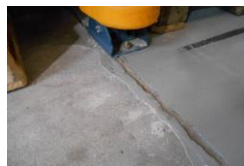
De vloer wordt gerenoveerd, links is de toplaag reeds verwijderd, rechts nog niet