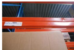
De beschadigde ligger in stellinggang J