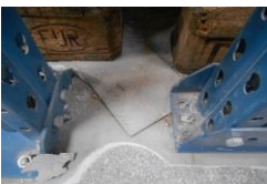
Hier zijn de uitvalplaten onder het juk uit geschoven