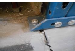
Verankeren in de krimpvoeg is niet toegestaan en niet functioneel