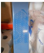
Diagonaalschoring die blijkbaar als opstapje wordt gebruikt. Dit is niet toegestaan.