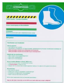
Het nieuwe bezoekersreglement is duidelijke en voldoet goed